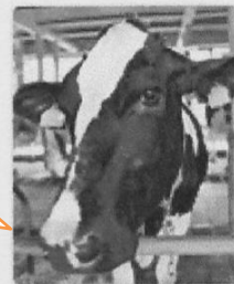
ユキ (ホルスタイン種) 2005年6月2日生まれ