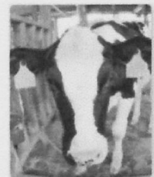
ホルン (ホルスタイン種) 2009年5月8日生まれ